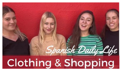
Clothing & Shopping in Spain