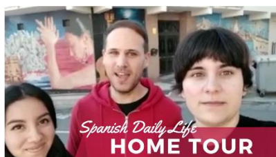
Spanish Home Tour