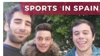
Sports in Spain