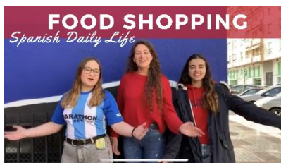
Food Shopping in Spain