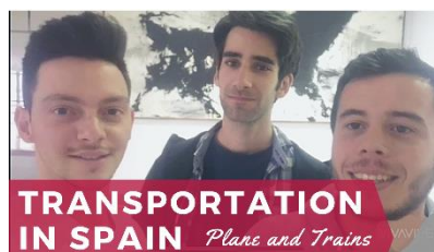
Transportation in Spain